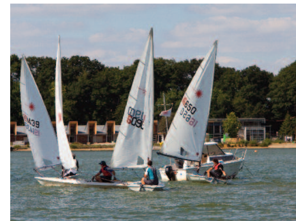
Base de loisirs

Aujourd'hui, Trappes-en-Yvelines écrit une nouvelle page de son développement. A vous d'y participer.