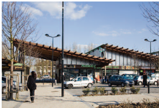
Centre Commercial des Merisiers