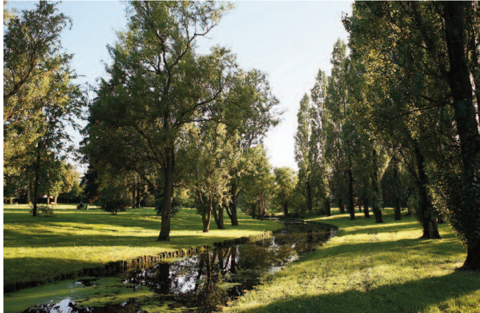
Parc Le Village

Située à l'ouest résidentiel de Paris, la ville de Trappes-en-Yvelines construit un nouveau quartier : les portes de l'Aérostaf. Bien aménagé : deux grandes avenues arborées incitent à la promenade. Bien desservi : un bus local assure les trajets de proximité. Bien construit : il accueille des immeubles de grande qualité architecturale.