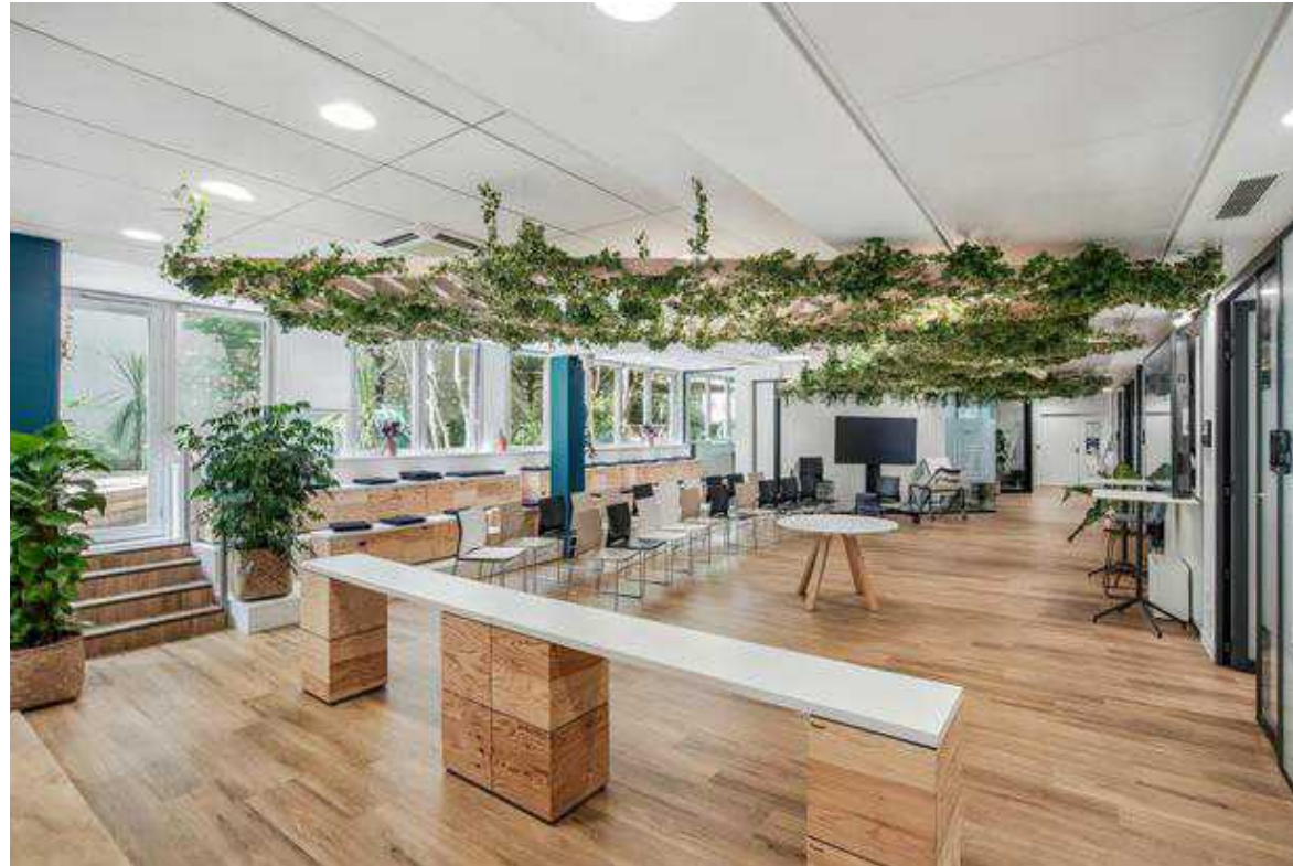
RDC / Cuisine