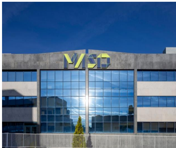
Oficinas en alquiler