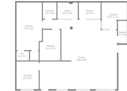
Plan (croquis) TOTAL 1001 sq. ft. Rue de la Montée 1001 sq. ft. Sud-Ouest (Montreal) - 4391 1001 sq. ft.