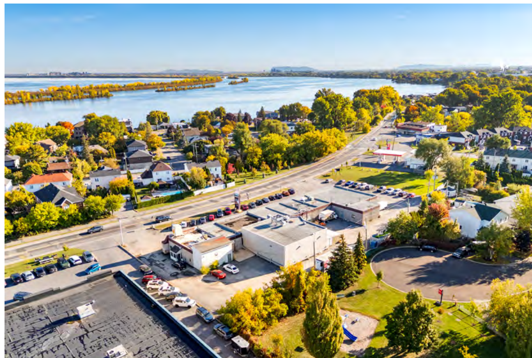
Local commercial - Retail Space 26A rue Marie-Victorin · Delson (QC)