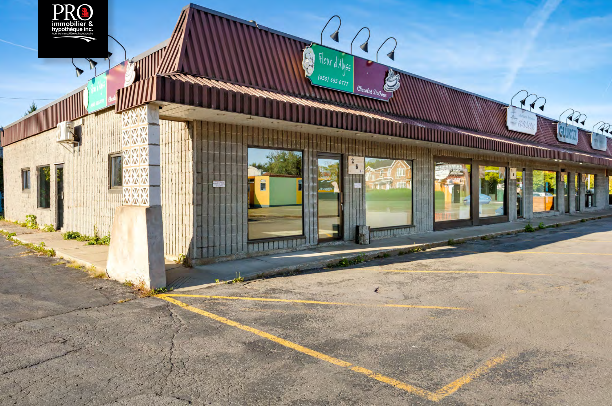
Local commercial - Retail Space 26A rue Marie-Victorin · Delson (QC)