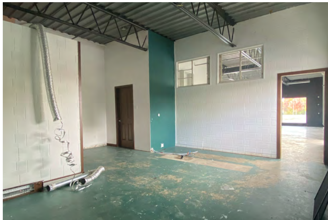
Local commercial - Retail Space 26A rue Marie-Victorin · Delson (QC)