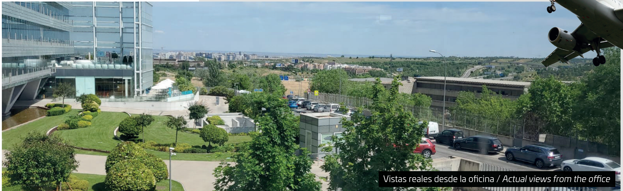
Vistas reales desde la oficina / Actual views from the office