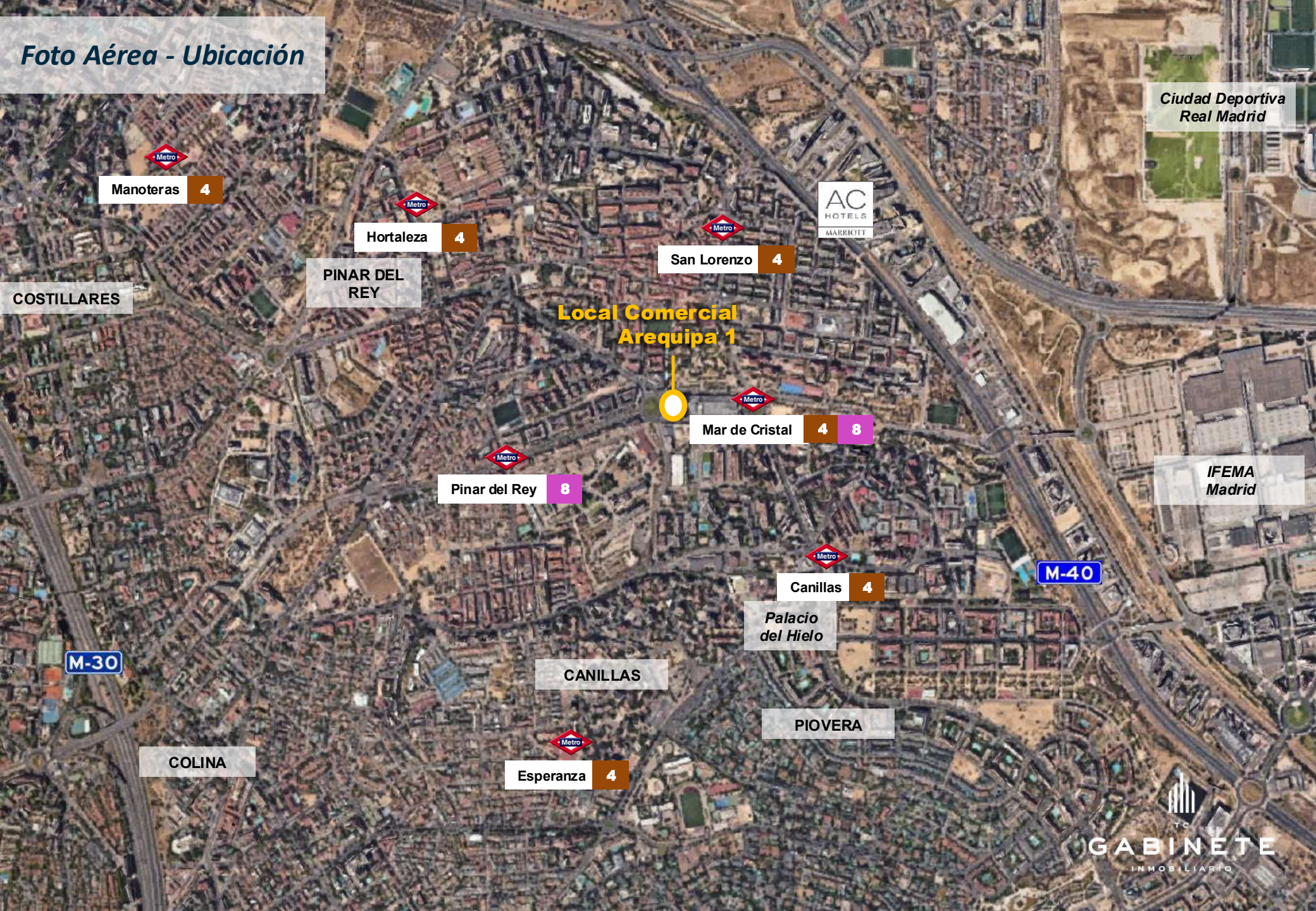
Foto Aérea - Ubicación