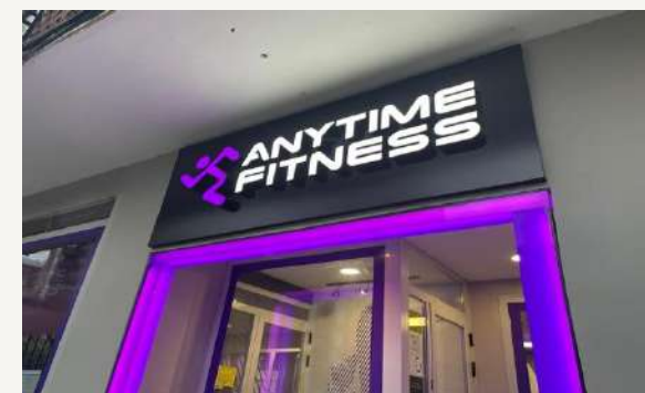
Anytime Fitness Hortaleza C. De Mota del Cuervo 30 – 850m.