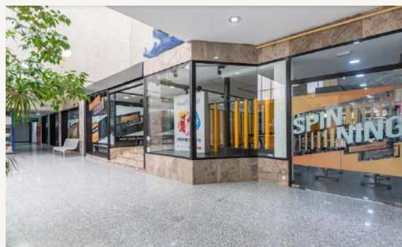
Urban Loft Fitness Av. de Bucaramanga 2 – 850m.