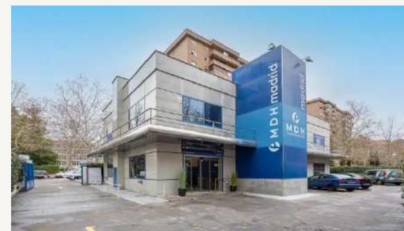
CDH Centros Médicos - Hortaleza C. De Torquemada 26 – 350m.