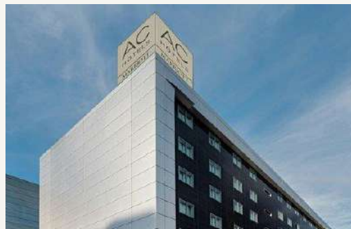
Hotel AC Madrid Feria **** Vía de los Poblados 3 – 2km.