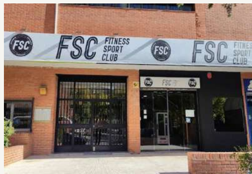
FSC Fitness Sport Club C. De Malagón 2 – 450m.