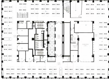
30e étage | 30th Floor