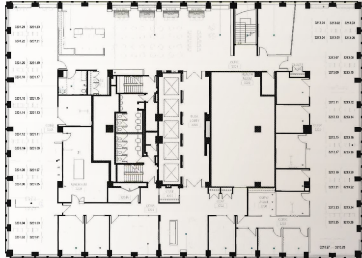
32e étage | 32nd Floor