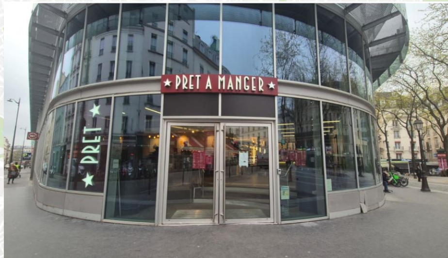
10 place de Budapest | 75009 Paris