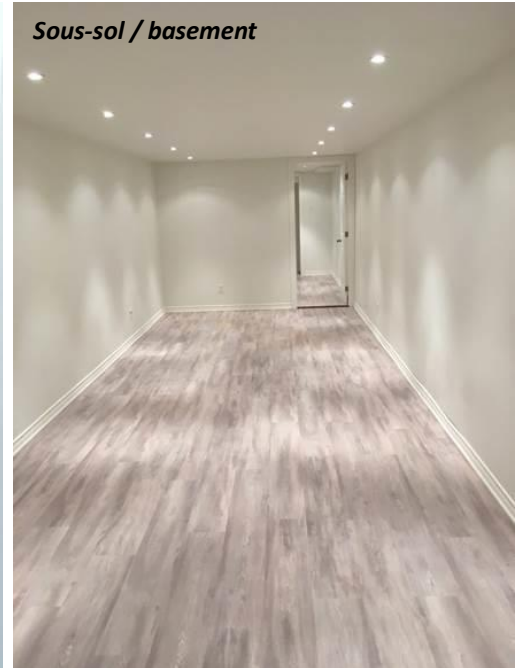
Sous-sol / basement