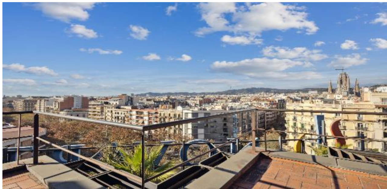
• MONUMENTO · GRAN VIA 764 · BARCELONA