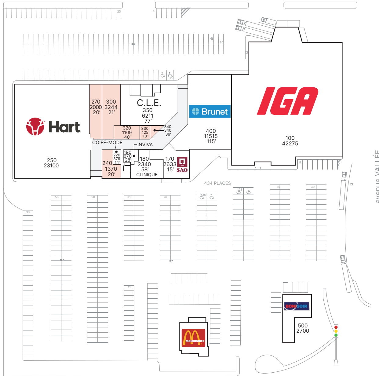
rue BILODEAU — route 116