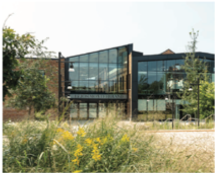
Block 2 - 3 west of Place de l'Île-Philemon

Blocks 2 & 3 are former industrial buildings, beautifully rehabilitated and repurposed into unique retail and office space. Located to the east of Eddy Street in Gatineau, and to the west of the welcoming Place de l'Île-Philemon, the brick and beam structures of Blocks 2 and 3 are joined by a striking glass atrium. Nearby Public Works campuses, the residential "O" building, engaging outdoor spaces, and previously inaccessible waterfront, make Blocks 2 & 3 a dynamic setting for ground-floor retail tenants.