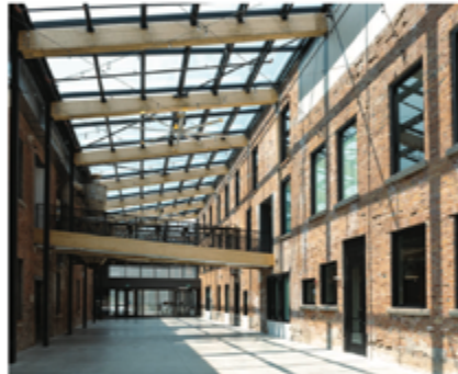
Glass atrium joining Block 2 - 3