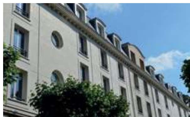
33, Rue de l'Aigle - La Garenne-Colombes Architecte Cabinet Chaplain