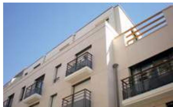
187 Aguesseau - Boulogne-Billancourt Architecte Cabinet Zandfos 2