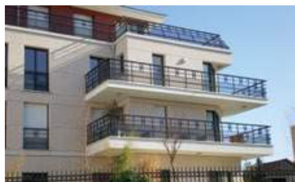
Le Jardin des Sentes - Meudon Architecte Hugues Jirou