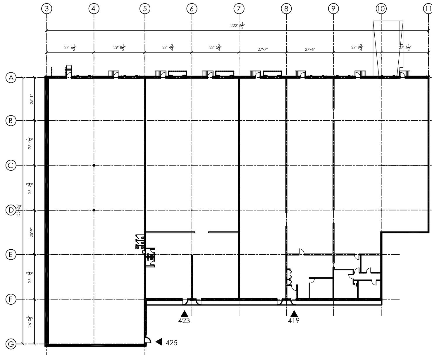
PLAN DES LOCAUX 419-425