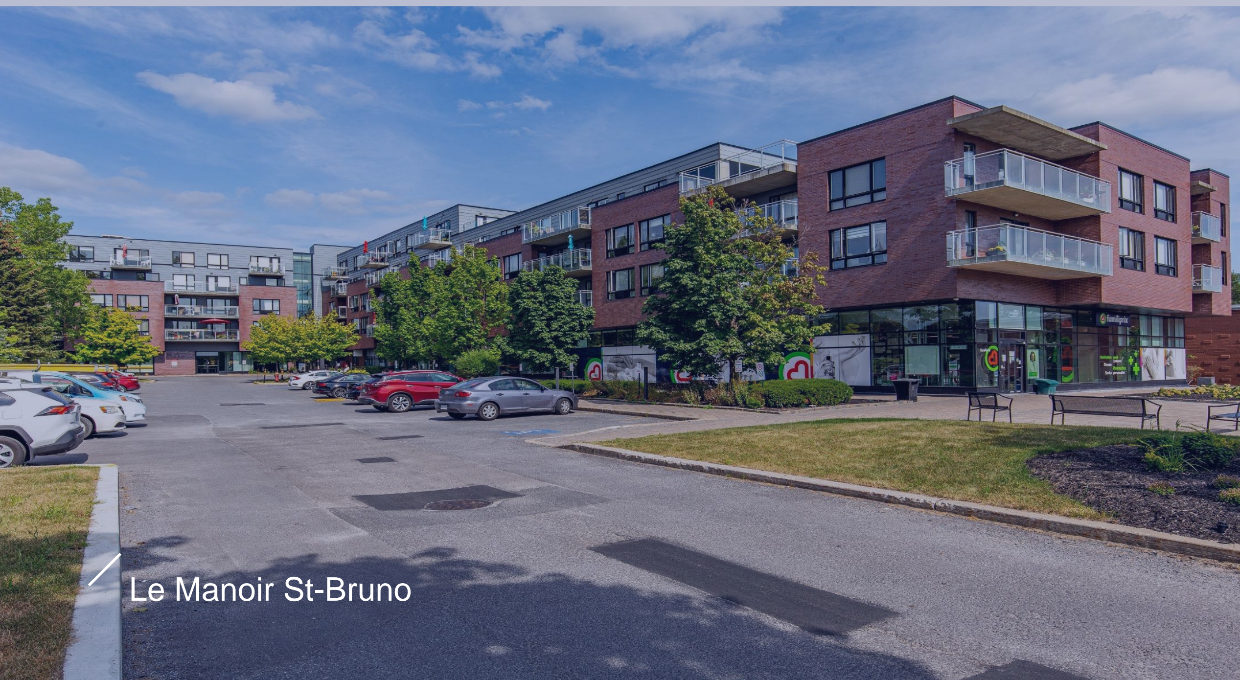
Le Manoir St-Bruno