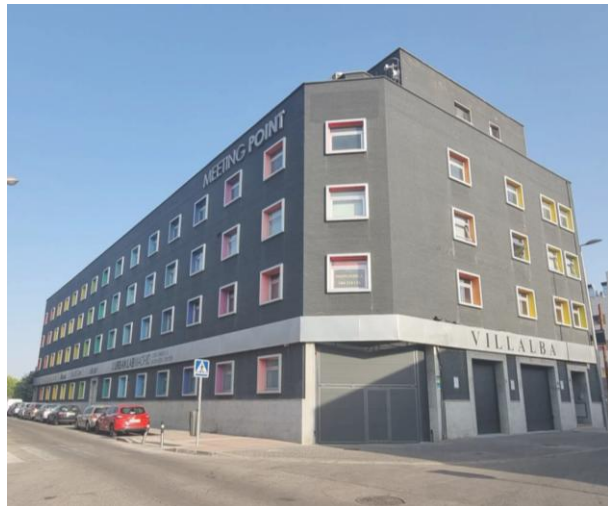
Oficinas en alquiler y venta