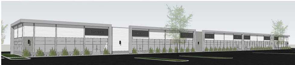
Rendu du Marché Buckingham - Marché Buckingham's rendering