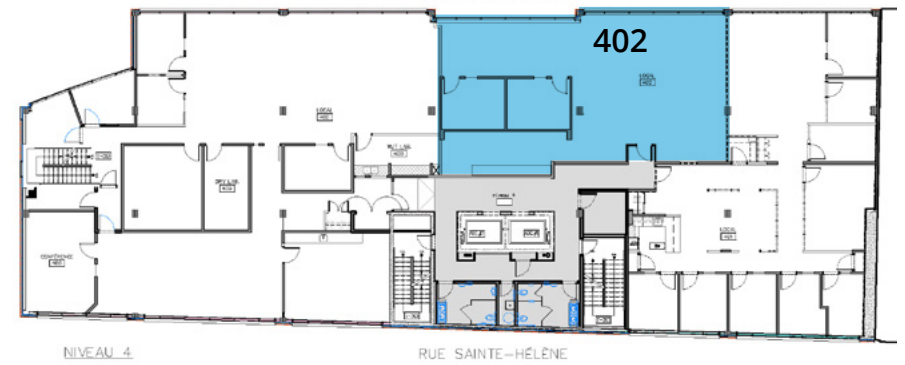
4 e étage