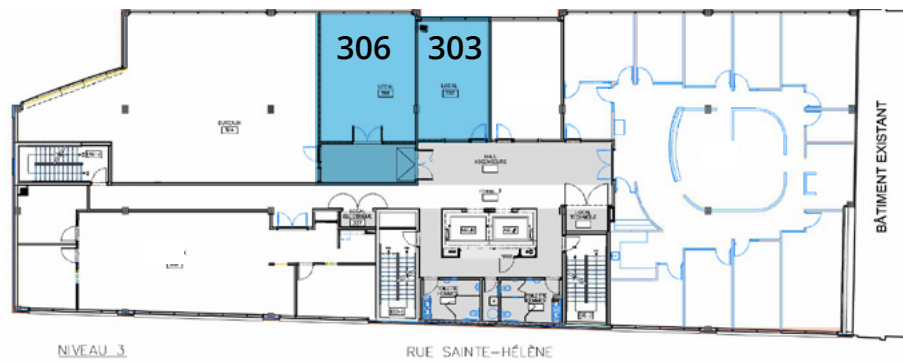
3 e étage