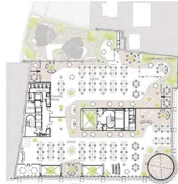
FOURTH FLOOR, CURRENT LAYOUT, DECEMBER 2024

Queda prohibida la difusión, reproducción, publicación y/o promoción de cualquier tipo, de la información contenida en el presente documento que no fuere de carácter público y muy especialmente, de las imágenes de los Inmuebles que obran en el mismo, en cualquier medio físico u online, sin la previa autorización expresa de CBRE Real Estate, SA.