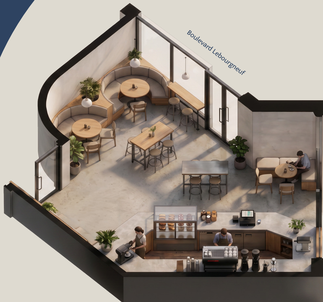
Image à titre indicatif. Aménagement proposé illustrant le potentiel de l'espace.