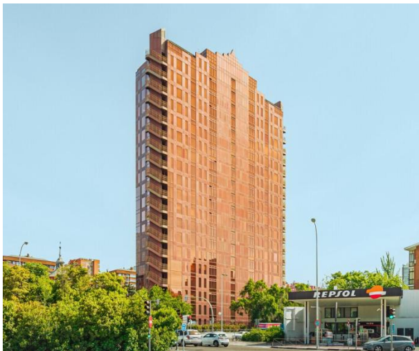
Oficinas en alquiler