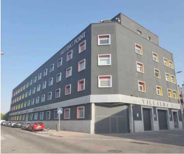
Oficinas en alquiler y venta