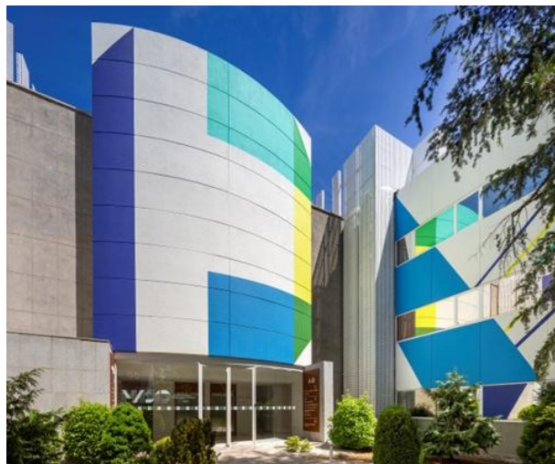
Oficinas y laboratorios en alquiler