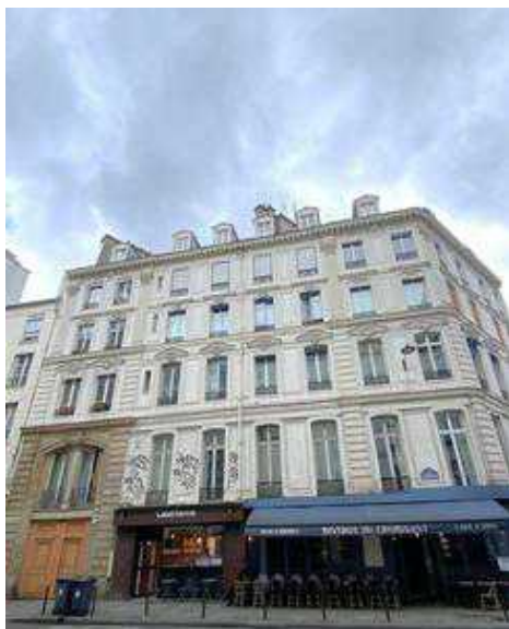
Bourse – Grands Boulevards