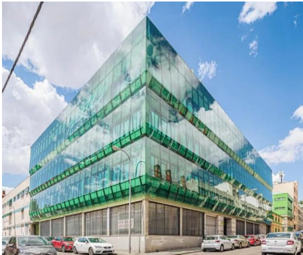
Oficinas en venta y alquiler