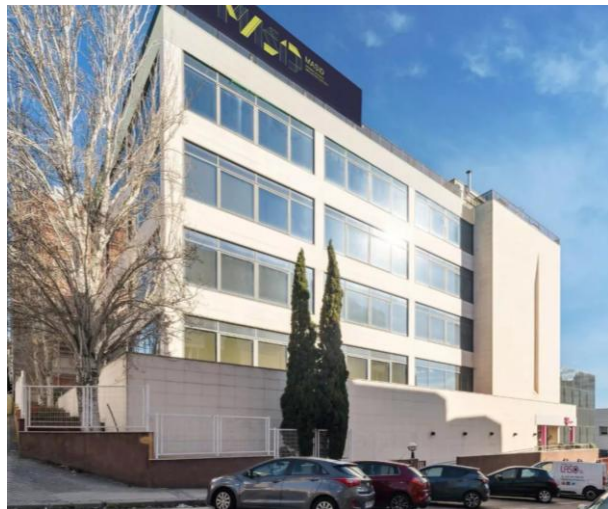
Oficinas en alquiler