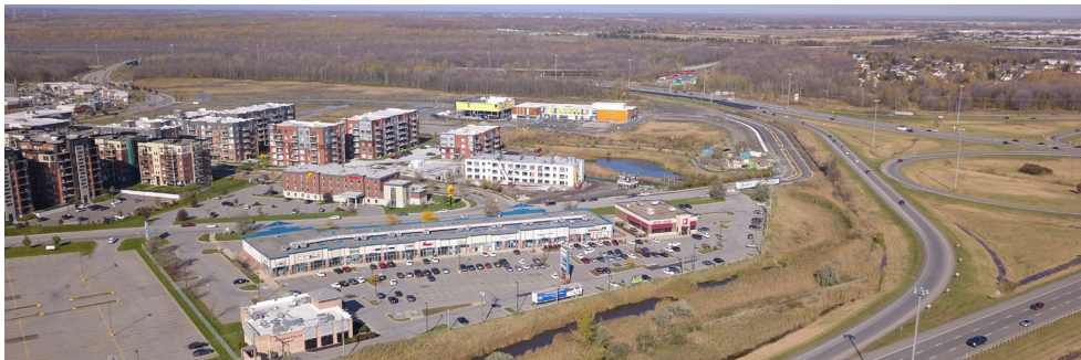
Vue aérienne du Marché Lachenaie - Aerial view of Marché Lachenaie