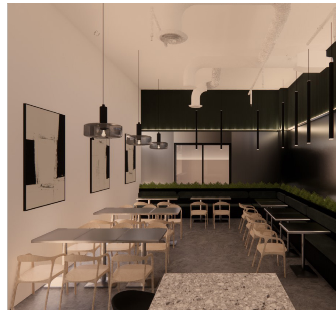
SALON DES LOCATAIRES