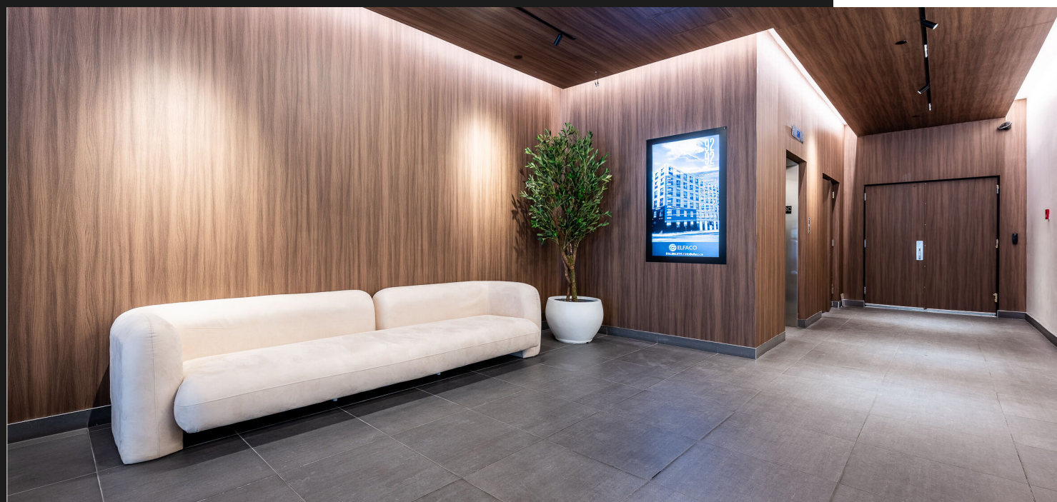
HALL DE RÉCEPTION