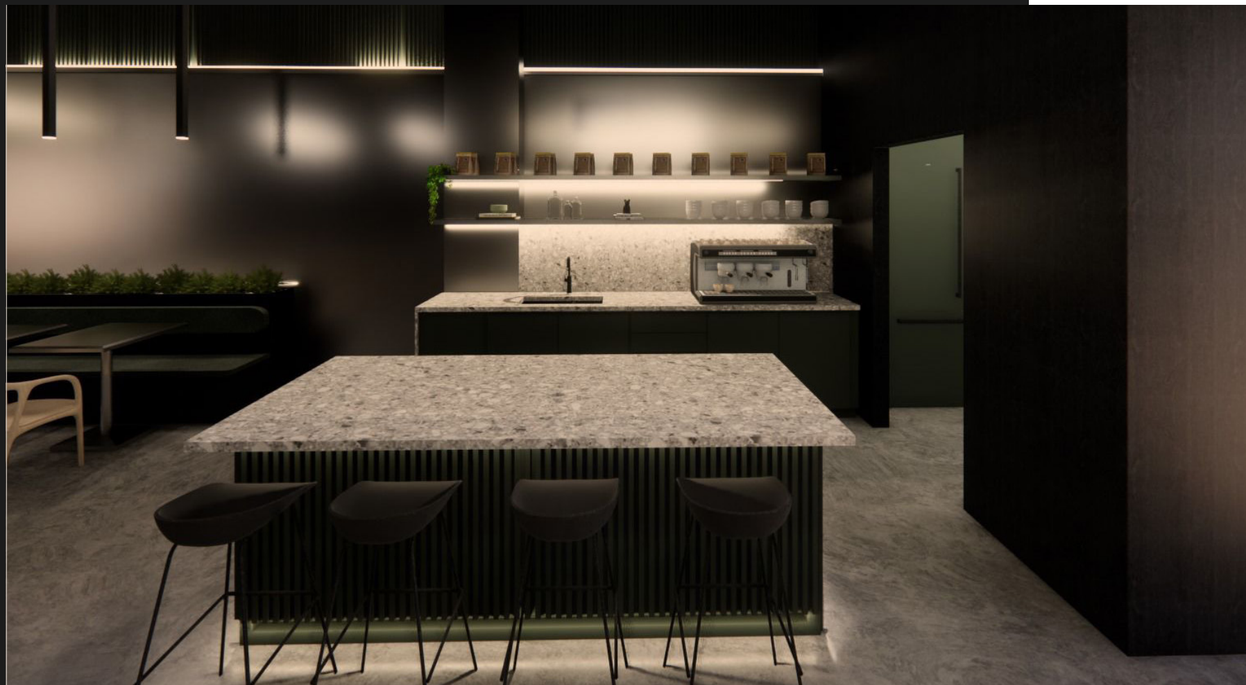
NOUVELLE CUISINE/ CAFÉTÉRIA